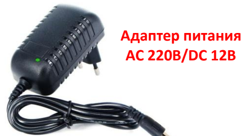
Адаптер питания AC 220В/DC 12В