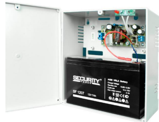
БЛОК РЕЗЕРВНОГО ПИТАНИЯ

Кнопка выхода исключает необходимость в считывателе